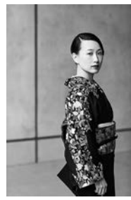
講師 伊藤仁美先生

きもので銀座は、日本の伝統的民族衣装の「きもの」を多くの人が着る機会を増やしてもらおうと企画しており、同時に美容師の着付け技術のPRや美容師自らが「きもの」について学ぶことも目的にしています。 9回目を迎えた今年の「きもので銀座」は、講師に有名着物家の伊藤仁美先生を招き、着物に関する講座を聴講できます。 きものを着て、お洒落もして、皆で銀座を楽しみます。 せんか。皆様からの沢山のご参加をお待ちしております。 ☆募集概要 ○期日 令和5年10月31日(火) 正午・集合※参加者はなるべく着物を着装ください。 ○内容 ①第一ホテル東京にてお食事(お弁当) ②伊藤仁美氏の講演「enso」主宰。京都祇園禪寺生まれ。西陣和装学院で師範取得後、一般着付