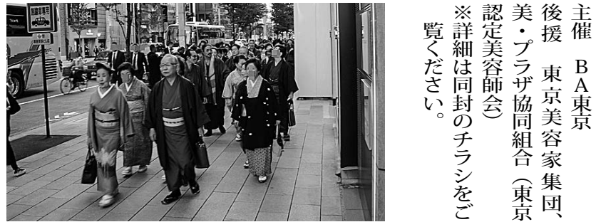
主催 BA東京 後援 東京美容家集団、美・プラザ協同組合(東京認定美容師会) ※詳細は同封のチラシをご覧ください。

から婚礼・芸舞妓の特殊技術習得まで10年間の修行期間を経て実践へ。伝統を軸に新たな着物の可能性を追求し続けている。/テーマ「着物とウェルビーイング」 ③和装着物で銀座散策 ※雨天の場合は散策中止 ○参加費 7,000円 ○募集人数 150名 ○申込み 本紙同封チラシの裏面にある申込書をFAXいただくか、または所属の支部長さんまで。