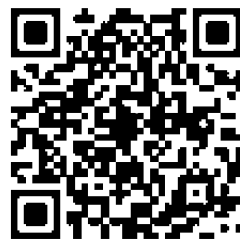
第64回特設サイト・エントリー