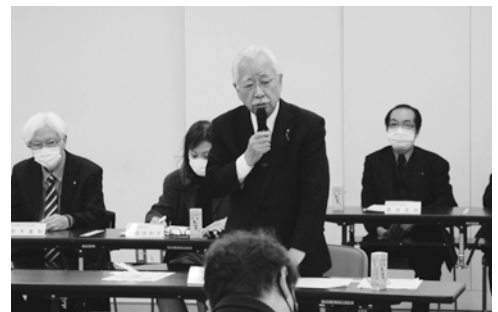
第2号議案 会館9階TBホールで開催することが承認されました。

第1号議案 第74回通常総代会の開催について 5月23日(火)午後1時から第74回通常総代会を美容